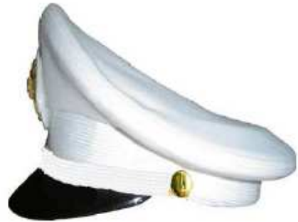
ชาย (ด้านข้าง)